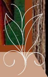
Γενέσιον Τιμίῳ Ἰωάννου Προδρόμου (τιμᾶται τὴν 24ῃ Ἰουνίου)