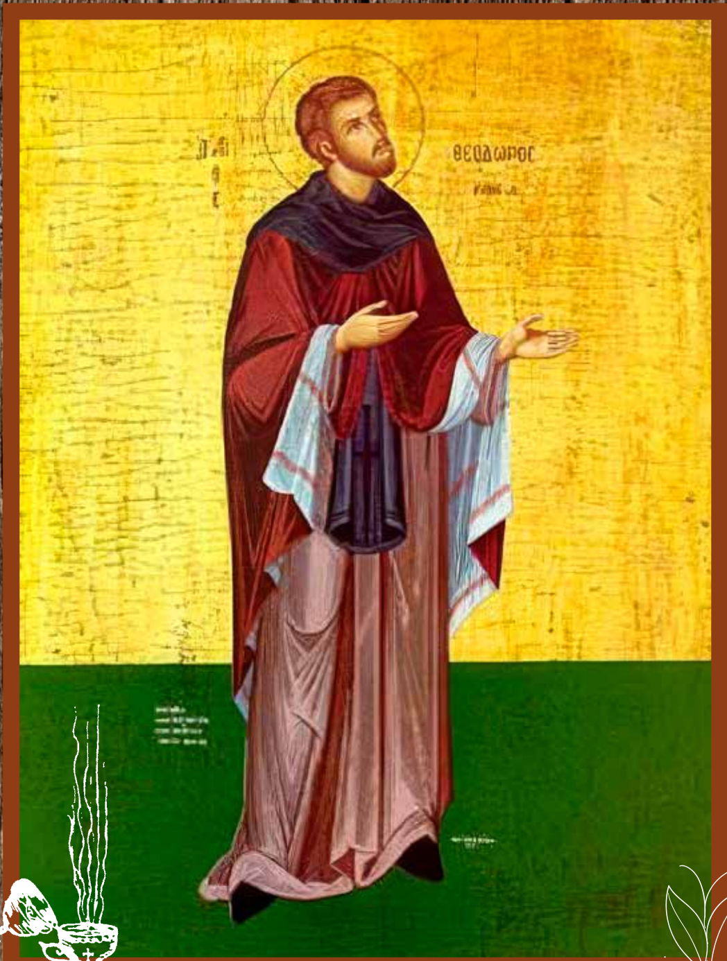
Ὁσιος Θεόδωρος ὁ ἐκ Κορώνης καὶ ἐν Κυθήροις ἀσκήσας (τιμᾶται τῇ 12ῃ Μαΐου)